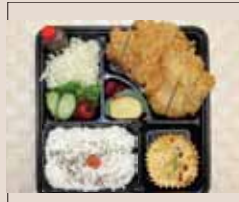
カツを増し値段を変更しました