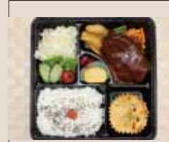
ハンバーグ 特盛り弁当 915yen