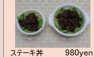
ステーキ丼 980yen ミニステーキ丼 680yen