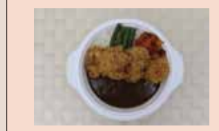
チキンカツカレー 540yen

メンチカツカレー 645yen カツカレー 645yen ハンバーグカレー 645yen カレーライス 430yen