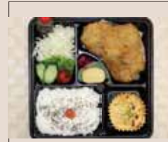
メンチカツ 特盛り弁当 860yen