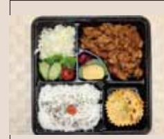
焼肉 特盛り弁当 755yen