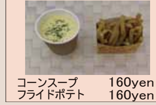
コーンスープ 160yen フライドポテト 160yen