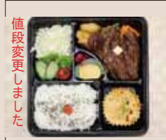
特テキ 特盛り弁当 1550yen