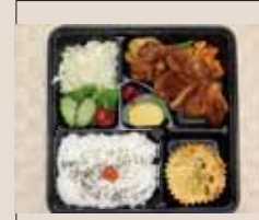
チキンソテー 特盛り弁当 755yen