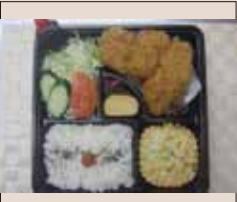
ヒレカツ 特盛り弁当 1000yen