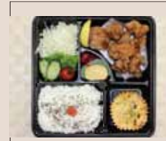
からあげ 特盛り弁当 755yen