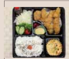
チキンカツ 特盛り弁当 700yen