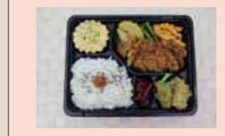
チキンソテー弁当 540yen